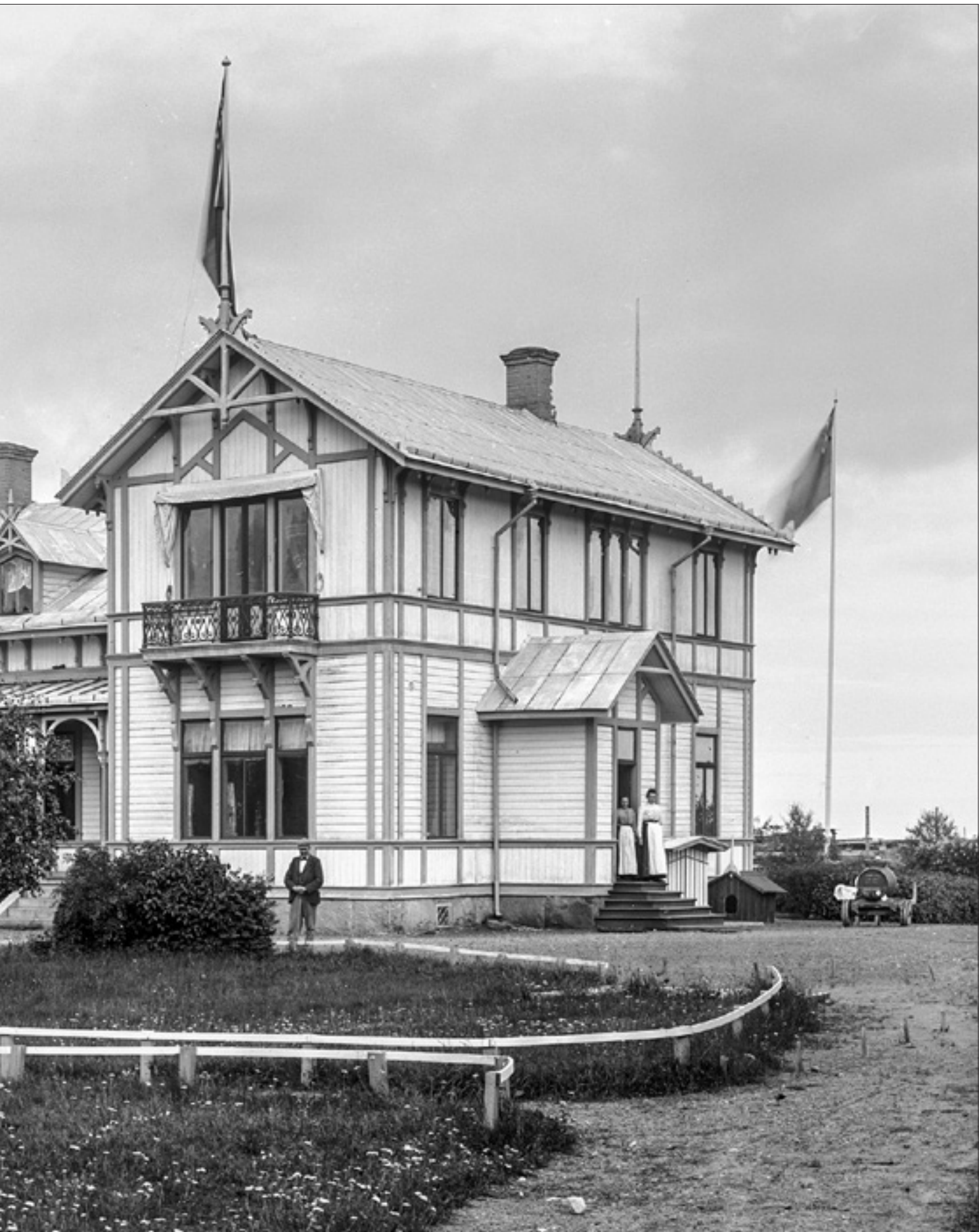
Observera människorna på fotot; noga uppställda - även på taket!