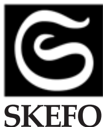
Foto sid. 5:  This work is licensed under the Creative Commons Attribution-Share Alike 2.0 Generic Licence. To view a copy of this licence, visit http://creativecommons.org/licenses/by-sa/2.0/ or send a letter to Creative Commons, 171 Second Street, Suite 300, San Francisco, California, 94105, USA.

Tidskriften Skelleftebygden ges ut av SKEFO, Skelleftebygdens lokalhistoriska förening. Rolf Granstrand, redaktör och ansvarig utgivare 070-266 87 23, rolf.granstrand@gmail.com Peter Grahn, redigering och grafisk form - Tryckt av Skellefteå Tryckeri AB 2016.