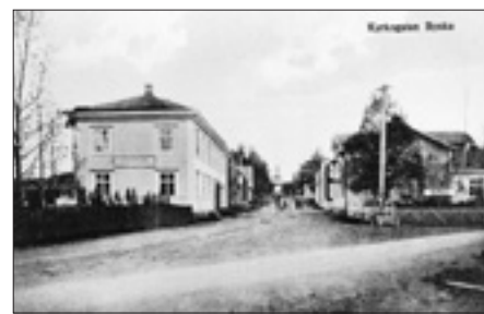
Gatuvy tidigt 1900-tal

När E4:an drogs fram försköts centrumfunktionen i Byske från området vid kyrkan till nuvarande plats längs Storgatan öster om E4. Området speglar den expansion som skett under 1900-talet. Axel Holmlund startade 1885 en mindre butik i Byske, en rörelse som ännu etthundratrettio år senare lever kvar i form av ICA Supermarket. Holmlund drev sin affär vid vändskivan i korsningen Storgatan/Kyrkogatan. 1912 lät han där uppföra ett nytt affärshus i senaste arkitekturstil. Under årens lopp har huset kommit att innehålla allt från järn- och diversehandel till dagens restaurang.