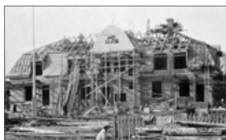
Nya huset under uppbyggnad