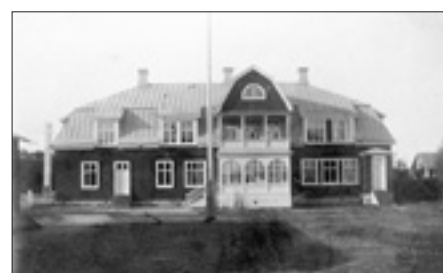
Nya huset efter uppbyggnad