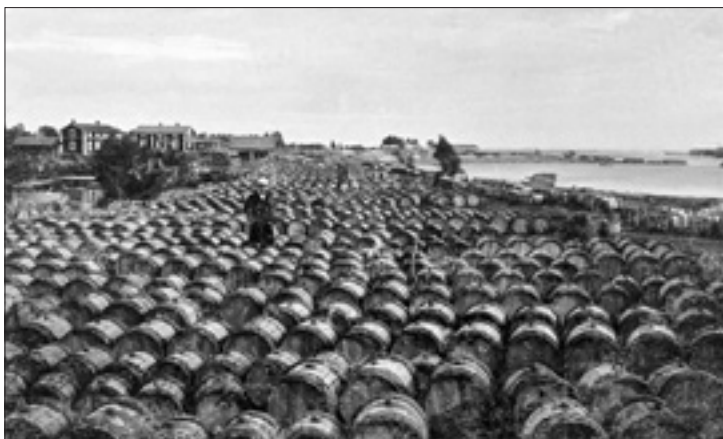
Tjärhovet i Ytterstfors

Ernst Häggquist skrev om Byske i Svenska turistföreningens årsskrift 1908 och 1913. Bägge bröderna hade tagit bilderna till artikeln 1908, medan Ernst var ensam fotograf 1913. Dessa foton är av stort kulturhistoriskt värde, bl.a. den bekanta bilden från tjärhovet i Ytterstfors, som ger en god uppfattning om tjärhanterings omfattning ännu i början av 1900-talet. I årsskriften från 1913 finns flera bilder som skildrar hur isen har pressat på mot bron som går över Byskeälven. En annan bild visar en s.k. Jakob-Jaksakärre, möjligen den enda kända av en sådan.