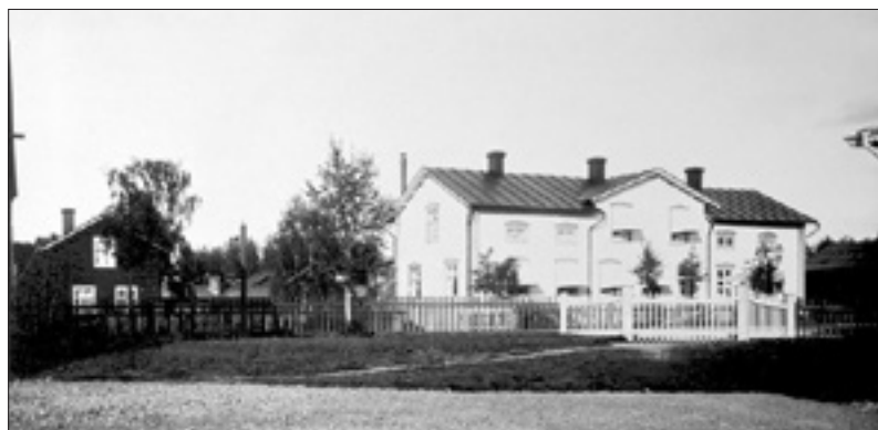
Holmlunds affärsfastighet fram till 1912 då nybygge skedde Se sidan 19 för fler bilder