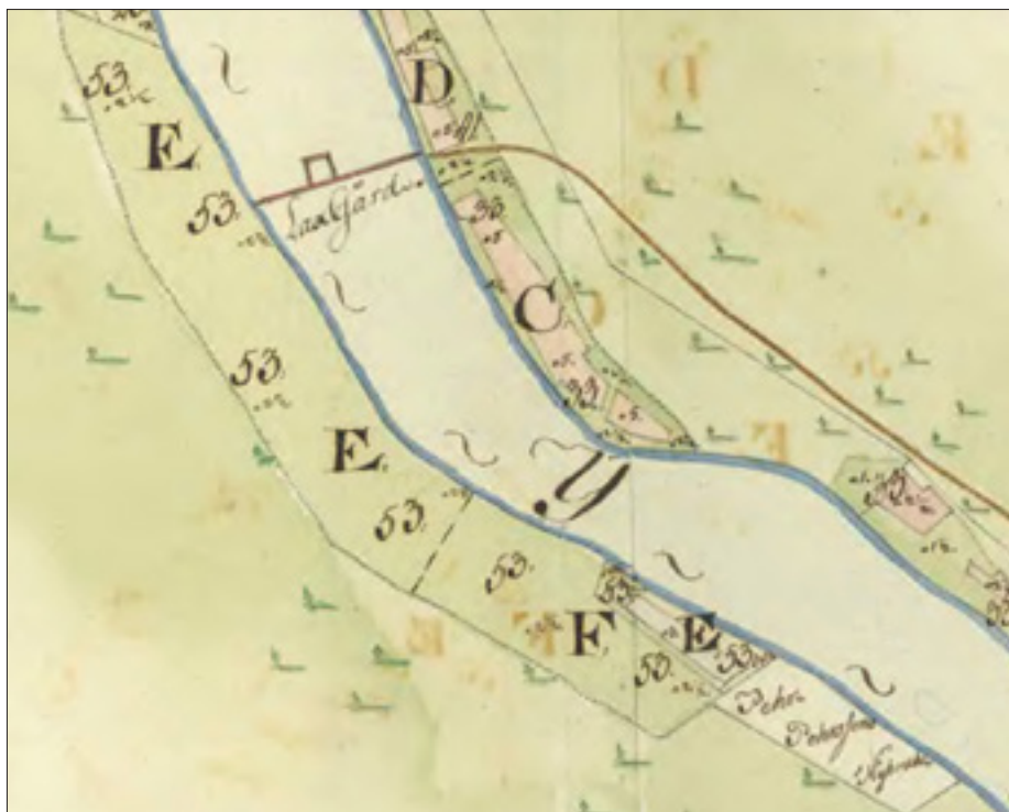
Storskifteskartan år 1800

Laxfisket i Byskeälven tycks vid slutet av 1700-talet i huvudsak bestått av karsinapata, dvs. en kvadratisk inhägnad av nedslagna pålar, störar och "grindar" mitt i älven, där laxen tog sig in genom en eller två ingångsöppningar men sen inte kunde komma ut. Anordningen kallas på storskifteskartan