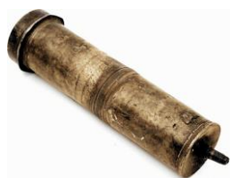
Lavemangsspruta som tillhört Engström. (Skellefteå museum, färglagd)

Han var en omtalad man som ska ha bott ett hus med stampat jordgolv dit särskilt kvinnorna vallfärdade. Han företog även resor inåt landet.