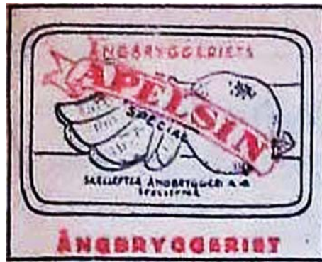
1949-07-01 För första gången fanns färg (=röd) på sidan men bara i första sidans huvud.

Skelleftebladet uppgick 1 juni 1951 i det då nystartade Nordsvenska Dagbladet som bildat genom en sammanslagning av moderata Umebladet, Skelleftebladet och Norrbottens Allehanda. Sista numret utkom 1951-05-31.