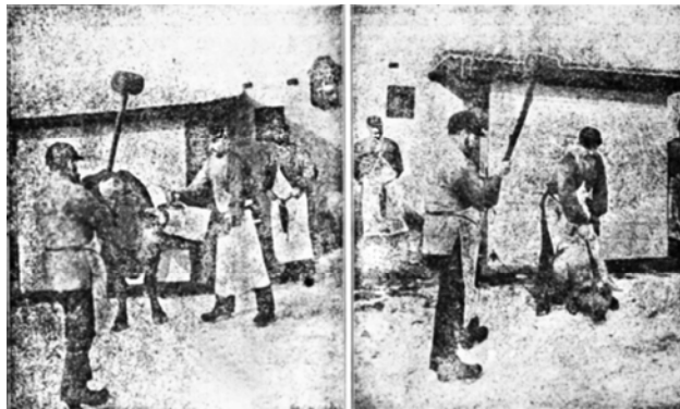
1896-11-19 Det första (?) fotot som publicerades i tidningen. Det var en annons "Mindre grymhet vid slakt" från Westerbottens läns djurskyddsförening som visade användning av slagmask