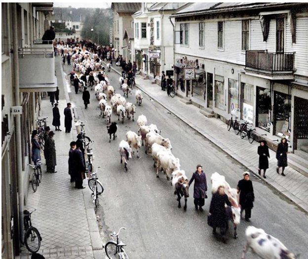
1944-11-08 Finländska flyktingar kommer med sina kor Stationsgatan söderut från järnvägsstationen. Iris Blomsterhandel finns på högra sidan av gatan norr om Burmans Ur&Optik