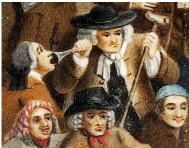
Mannen använder en örontrumpet i en brittisk målning från 1700-talet

Under de närmaste århundradena hände egentligen ingenting med grundkonstruktionen utom att man förskönade med färger, ingraveringar och reliefarbeten.