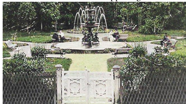
1899 För att manifesteras att man ordnat vatten och avlopp så skaffade man fontänen Johanna i Parken till Stadsträdgården (Skellefteå museum, färglagd)

Detta var en sanitär fråga lika mycket som vattendragningen och borde därför ordnas samtidigt. Så 1895 hade även 3 km avloppsrör grävts ner.