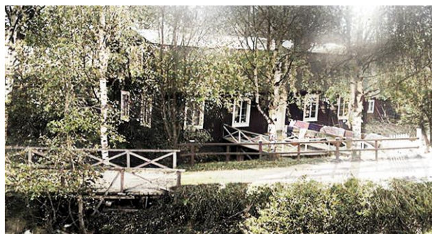
1931-10-01 Kaféet i Bullgroven på Nordanå som var badhus för hälsobrunnen Brunnsgården

Till brunnen hörde också en badhusinrättning som var byggd i sänkan där bäcken rann ut i älven. Det fanns också gyttjebad och dusch.