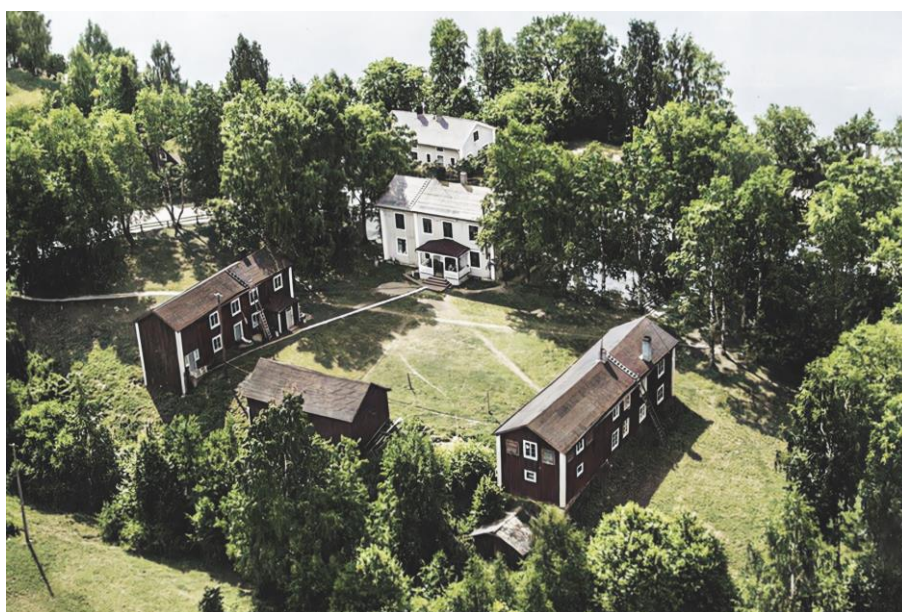
1947 Brunnsgården från norr med uthuslängor innehållande bostäder.

Brunnsgården renoverades och flyttades 1962.