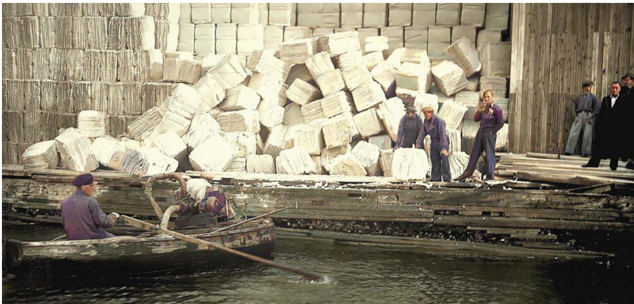
Rasplatsen (Abel J. Tjernlund)

Vid 19-tiden torsdag 13/6 1946 störtade ett upplag med massabalar på kajen i Byske trämassefabrik samman.