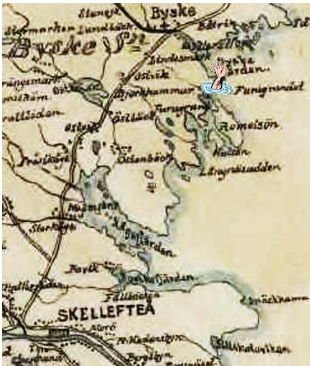
Olycksplatsen på en karta från 1800-talet

Vid 19-tiden torsdag 13/6 1946 störtade ett upplag med massabalar på kajen i Byske trämassefabrik samman.