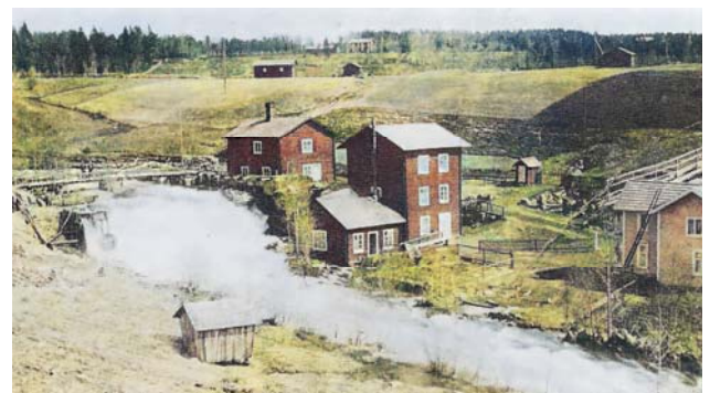
1920-tal. Lindalmström där olyckan skedde strax ovanför kvarnen som är den höga byggnaden. T.v. om kvarnen står färgeriet och presshuset och nedanför finns vadmalsstampen

läkare anlät till platsen kunde denne bara konstatera att båda var döda.