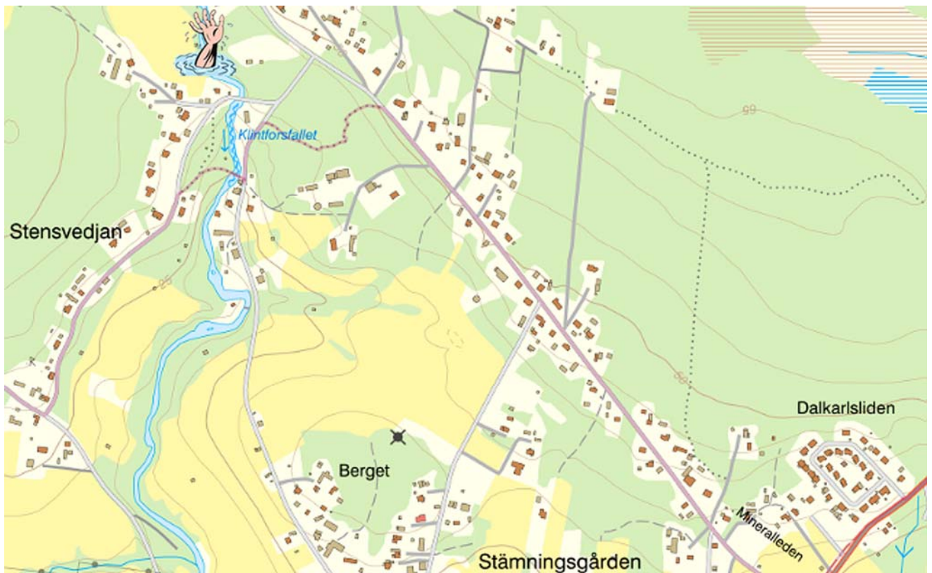
Klintforsfallet/Orrbyströmmen/Lindalmström med olycksplatsen utmärkt (Lantmäteriet)

På söndag kväll 20/7 1924 var en del ungdomar samlade på idrottsplatsen ovanför Lindalmström.