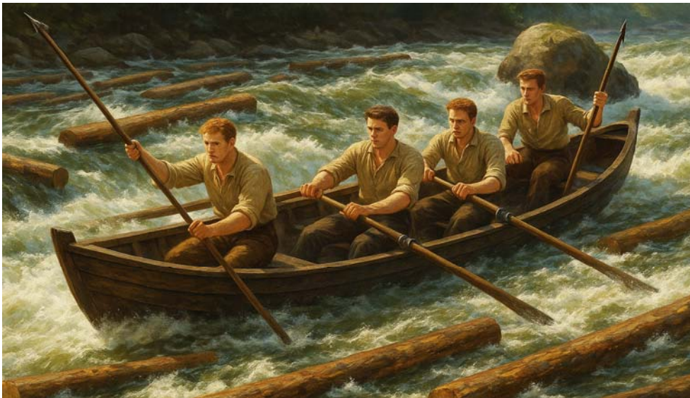
De fyra männen i forsen. (AI-genererat)

forsen. Då stötte båten ihop med en sten och kantrade.