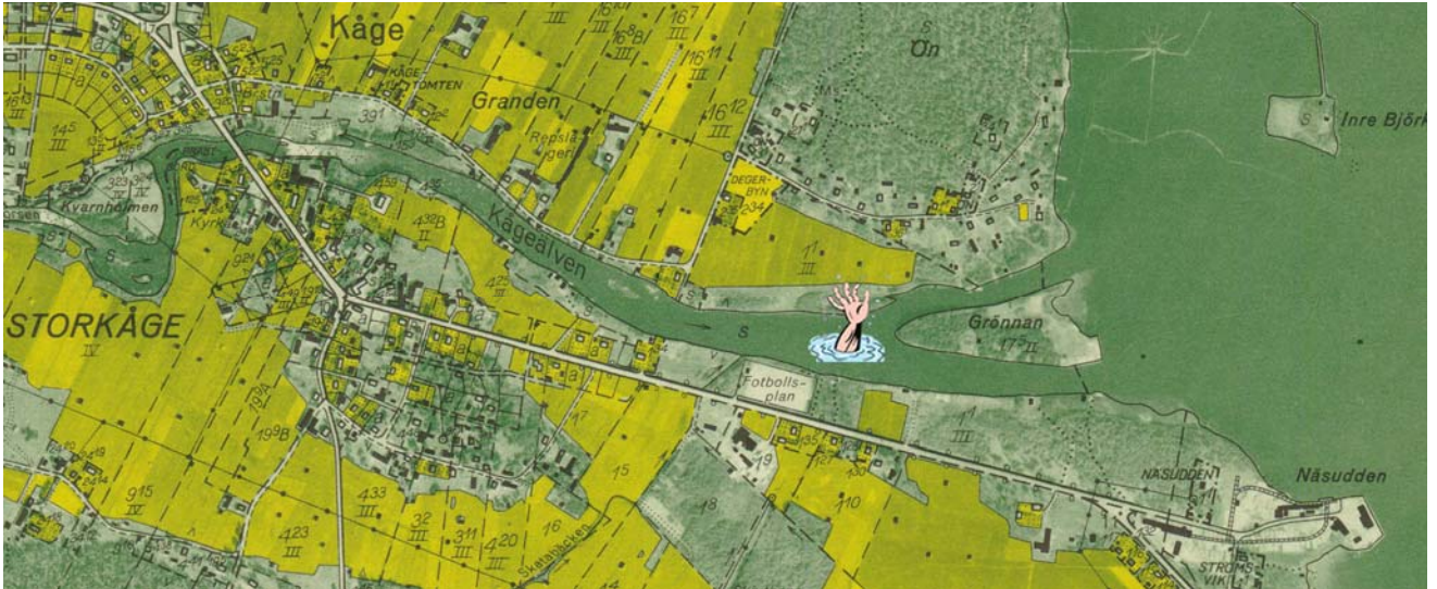
1960 Olycksplatsen på Ekonomiska kartan