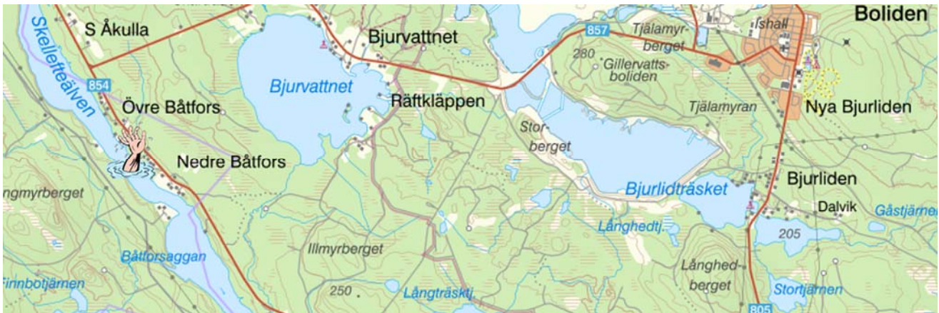
Olycksplatsen (aktuell karta från Lantmäteriet)

Onsdag 14/7 1852 var fyra drängar i arbete med timmerflottning. De hade gett sig ut i båt för att frigöra en mängd timmer som grötat ihop sig i