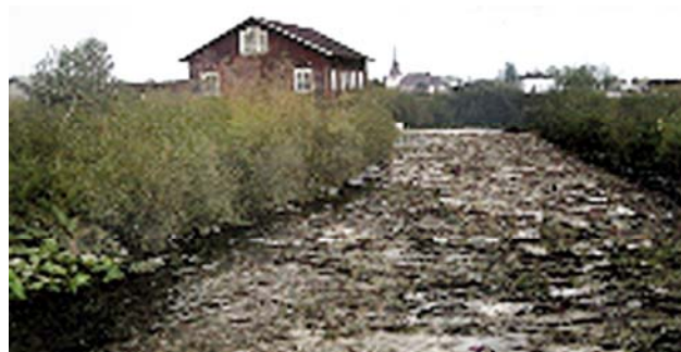
Uppströms Holmfors såg där de föll i