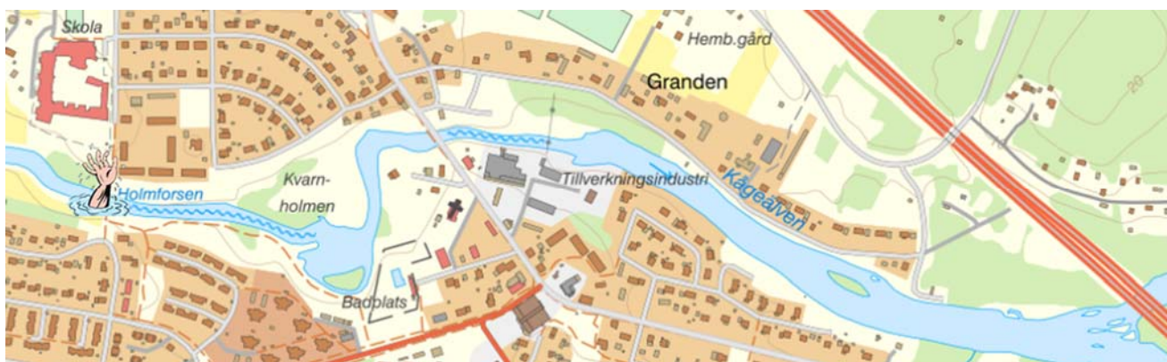
Olycksplatsen på nutida karta