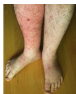
Exempel på benödem

Patienten låg flera dagar i yrsel men efter 15 dygn så släppte underbindningen. ”Patienten är nu frisk och haltar så obetydligt, att han under vintern kunnat gå på skridskor”.