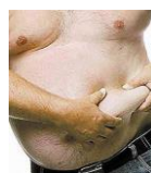
Exempel på ett vänstersidigt ljumsbräck hos en man

Lindström försökte först med åderlåtning, varma bad och lavemang. När det misslyckades lades mannen på en halmmadrass och en buköppning gjordes. Tarmen sköts på plats och det ledde omedelbart till att avföring kom igång. Han levde ända till 1871