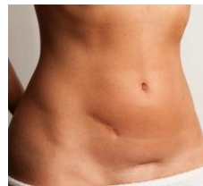
Exempel på högersidigt ljumsnbräck hos kvinna

Såret varades i 6-8 veckor innan hon till slut fick lämna sängen. Tarmarna föll inte ut i någon ny bräck-säck.