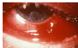
Exempel på gonorré i ögat

Barnet fick resa hem efter 14 dagar. Efter 8 månader var läppkanten nästan rak medan näsan var en aning sned.