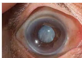
Exempel på grå starr (katarakt)

Avlägsnade linsen med en rak, platt nål och med hjälp av två män. Ännu inget resultat av operationen.