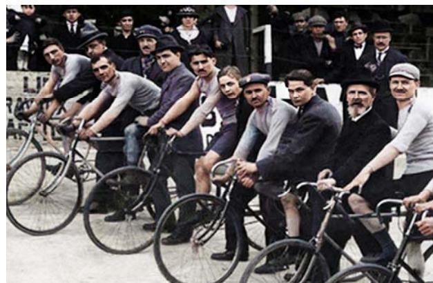
En av cykeltävlingarna som vanns av det franska laget

Frankrike sopade också med sig alla tre guldmedaljerna i cykling, den enda guldmedaljen i skytte, en av de två guldmedaljerna i tennis och vann fotbollsturneringen.