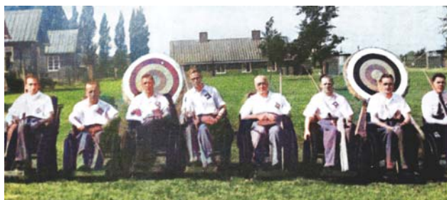
1948 Deltagare i bågskyttetävlingen (färglagd)

Samtidigt med OS i London ordnade han ett eget sportevenemang. Sexton veteraner i rullstol möttes i bågskytte- och nätbollstävlingar.