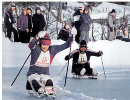
Tre brons togs i ispigging som varit uppvisningsgren 1976.

299 idrottare, 229 män och 70 kvinnor, från 18 nationer tävlade i 3 idrotter och 64 grenar. Sveriges tog 5 guld, 3 silver och 8 brons. Tretton av medaljerna togs i längdåkning.