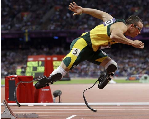
Pistorius kallades för "Blade Runner" efter en science fiction film

Pistorius fick ett dystert eftermäle. Han hade sedan 2012 haft ett förhållande med fotomodellen Reeva Steenkamp. Hon påträffades i Pistorius lägenhet i februari 2013 skjuten med fyra skott.