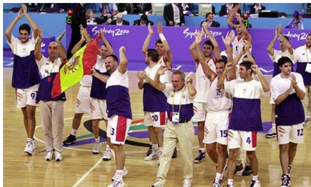
Det var när den här bilden av det segrande basketlaget publicerades i spanska tidningar som fuskets uppdagades. Läsare hörde av sig och berättade att de kände personerna och att de inte hade någon funktionsnedsättning

Chefen 2000 för det spanska förbundet för mentalt handikappade idrotter fälldes i domstol i Madrid och dömdes till personliga böter och att betala tillbaka de pengar man fått i statliga subventioner.