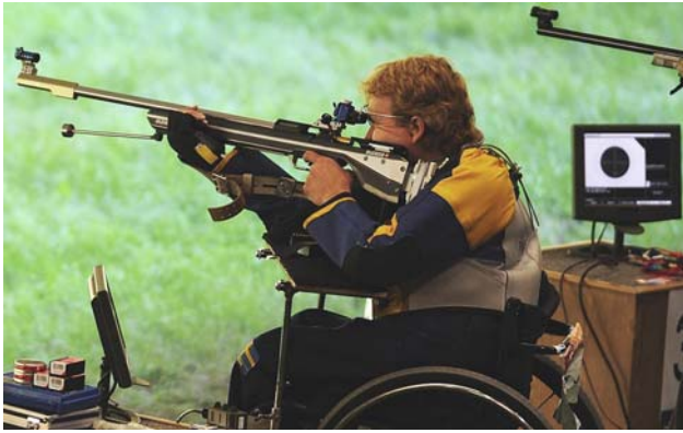
Jonas Jacobsson under försökstävlingarna.

Skytten Jonas Jacobsson tog guld i luftgevär 10 m stående, frigevär 50 m liggande och frigevär 50 m mix 3x40. Det året fick han som första paraspportare Svenska Dagbladets guldmedalj. Han har vid två tillfällen nominerats till priset som världens bästa paraidrottare till Laureus World Sports awards. Han har tilldelats priset som årets idrottare med funktionshinder 2001, 2005 och 2007.