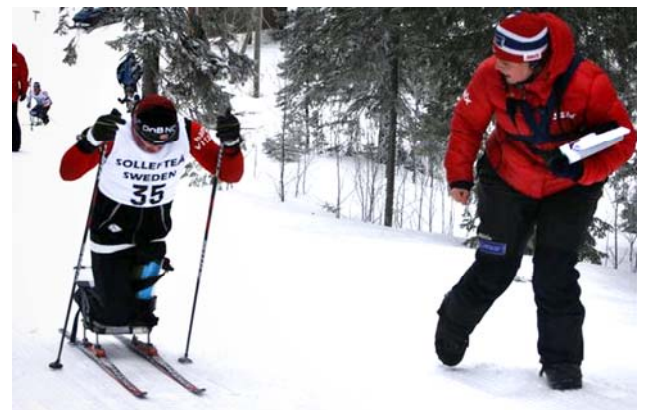
Termometern på Hallstabergets skidskyttestadion visade ned mot 18 minusgrader när starten gick

Det deltog 4,403 idrottare från 162 nationer som tävlade i 22 idrotter och 539 grenar. Sveriges tog 1 guld, 5 silver och 2 brons.