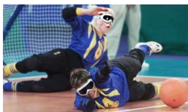
De svenska goalball herrarna tog brons liksom damerna.