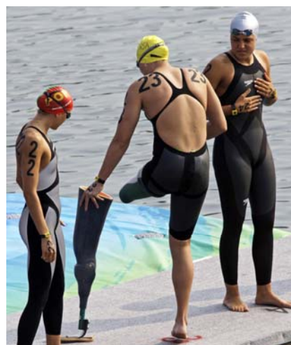
2008 Natalie du Toit vid starten på 10 km maraton i Beijing

I Beijing 2008 ställde hon också upp på OS och blev där 16e på simmaraton 10 km.