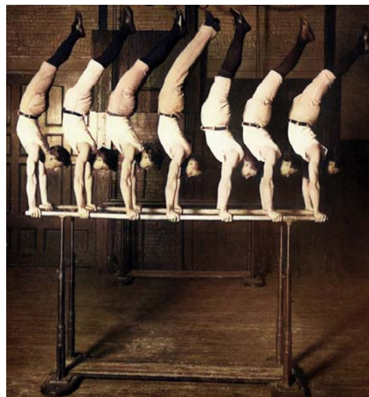
1908 Gymnastklubben Concordia med Eyser med byxor i mitten (färglagd)

Den 29 oktober 1904 blev hans stora dag. Då vann han guld i barr, bygelhäst och repklättring 25 fot och dessutom två silver och ett brons.