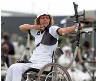
Nya Zealands Neroli Fairhall vann 1980 damernas bågskytte och togs senare ut till OS i Los Angeles 1984 där hon slutade på plats 35.

Nu tillkom även gruppen idrottare med CP-skada. Sittande volleyboll kom in på programmet och sommarparalympics hade nu 13 tävlingsidrotter.