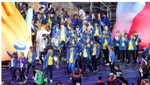
2023 Sverige tågar in i Berlin

2023 i Berlin hölls det 16e sommarspelet med 7,000 idrottare från omkring 170 länder som tävlade i 26 idrotter. Sverige deltog i basket (1 guld), bordtennis, bowling (1 g, 1 b), friidrott (1 g, 1 b), golf, judo (1 g, 1 s, 1 b), ridsport och simning (1 g, 1 b).