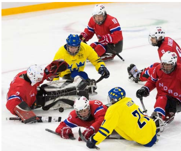
Sverige blev mästare efter sudden death mot Norge inför en fullsatt arena.