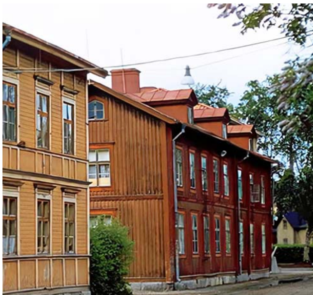
1958 ca Tjärhovsgatan norrut från Nygatan med annexet till ålderdomshemmet. År 1944 bodde 18 personer i annexet.