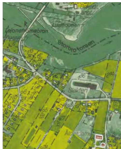
1946 Ekonomiska kartan med ålderdomshemmet nere t.h.