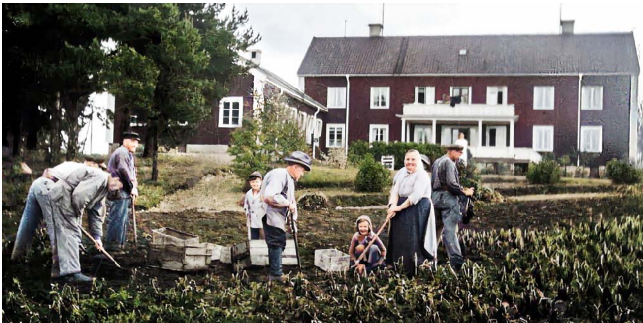
Ca 1933 Ålderdomshemmet med sjukpaviljongen t.v. (Abel J Tjernlund, färglagd)

Byske kommun hade från 1895 ett ålderdomshem, fattigstuga, i Frostkåge. Men kravet på modernisering och förbättring resulterad i att man från 1930 avvecklade det hemmet och byggde nytt i centralorten.