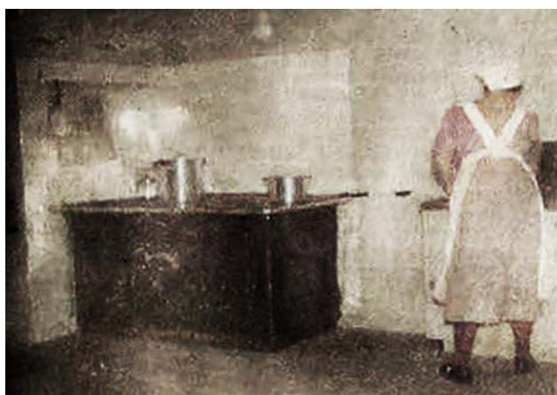
Köket i källaren på ålderdomshemmet (Skelleftebladet)

Diskussion pågick om att utvidga Sunnanåhemmet men istället skapades ett nytt ålderdomshem i Kusmark som ett försök att decentralisera åldersvården.