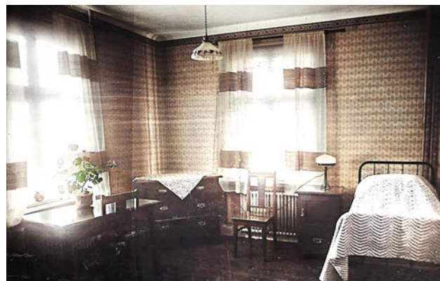
1927-10-01 Rum på ålderdomshemmet vid invigningen

Åren 1956-58 köper Skellefteå stad fastigheter vid Strandgatan för att där ge plats åt det nya ålderdomshemmet Strandgården som togs i bruk 1963.