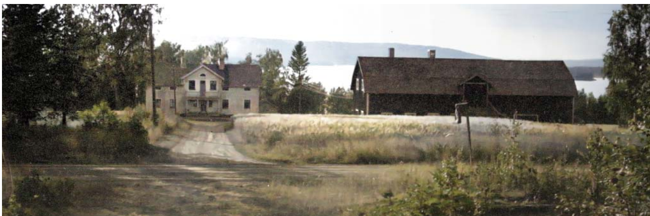
1950-tal. Den ombyggda prästgården på Prästudden blev ålderdomshem (färglagd)