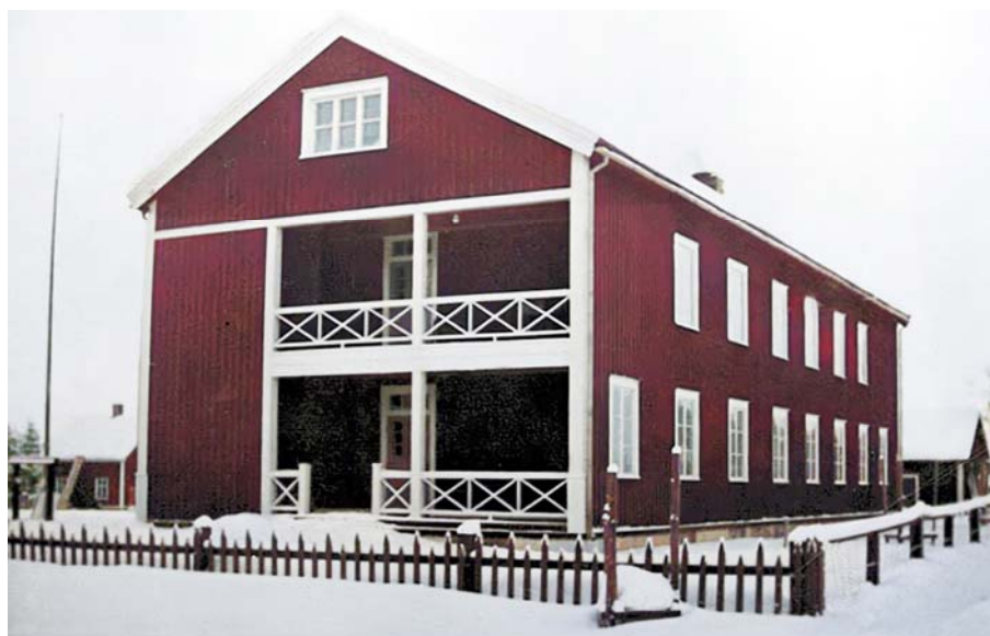
1936 Lördagen 19 januari 1936 invigdes ålderdomshemmet..