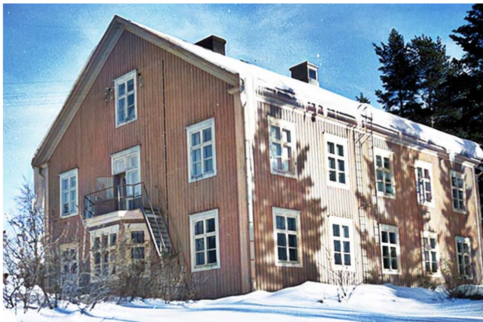
Ca 1950 Ålderdomshemmet i Bureå invigdes måndag 4/8 1930 År 1959 byggdes ett nytt ålderdomshem.

Ålderdomshemmet var placerat på Bureås vackraste plats nära Bureälven och inte långt från sjukstugan.