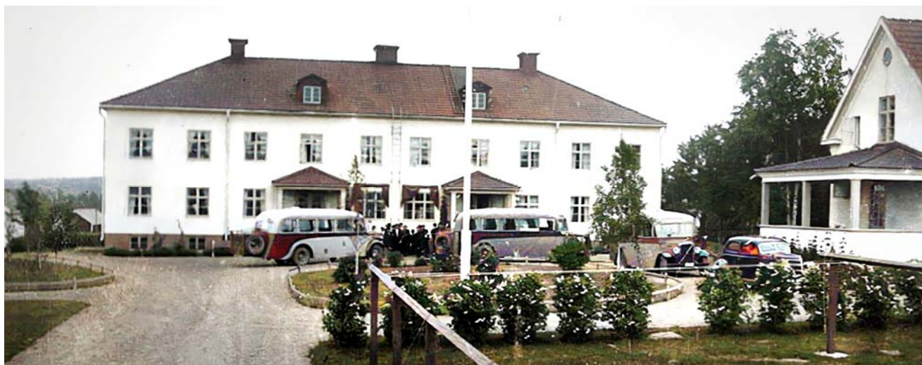
Ca 1935 Den stora byggnaden är ålderdomshemmet och t.h. hemmet för sinnessjuka och kroniskt sjuka

Kyrkvården Jonas Degermans hemman på Sunnanå inköptes 1923 av Skellefteå Landsförsamling för 40,000 kr.