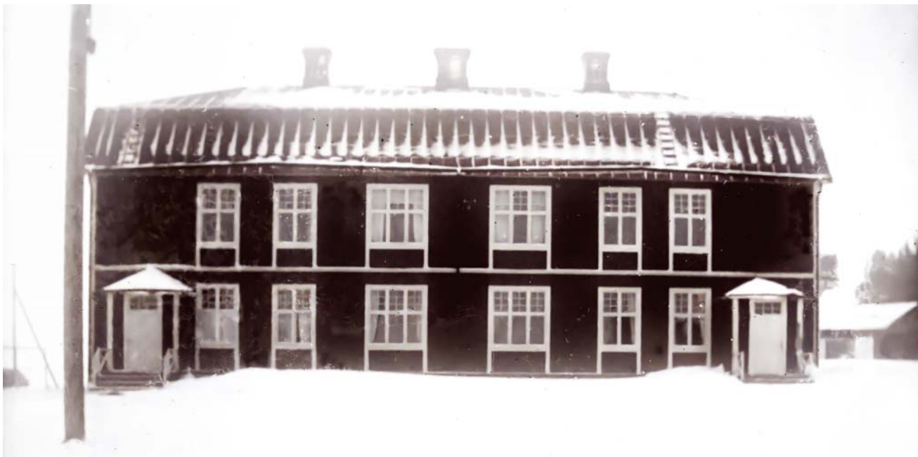
1920-12-18 Grannäs fattigård godkänt som ålderdomshem (, färglagd)