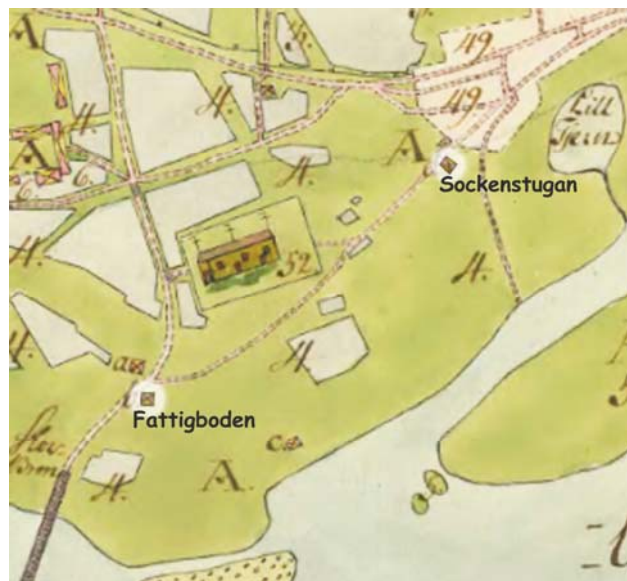
1764. Fattigstugan hade varit placerad sydväst om sockenstugan. I fattigboden lagrades allmogens kornleveranser (Lantmäteriet)

År 1727 inköptes en fattigstuga för 60 daler och placerades vid den vägen sydväst om sockenstugan.