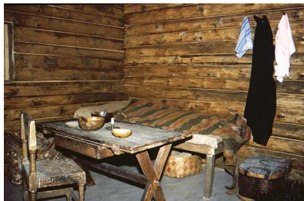
1988 Från utställningen "Från fattigstuga till servicehus"