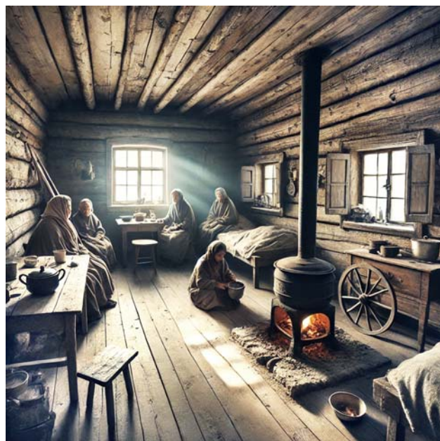
Fattigstuga (AI-genererad med ChatGPT)

Alla i fattighuset hade sitt lilla förråd av matvaror. Men spisen räckte inte till för de många pannorna. När någon fick en något matillbehör som gåva så blev de andra avundsjuka.