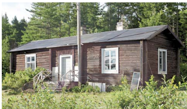
Fattigstugan på Öhn i Kåge (färglagd)