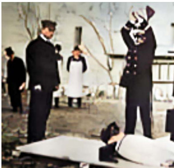
1890 Yngsjömöderskan avrättas i Kristianstad som sista kvinna i Sverige (färglagd)