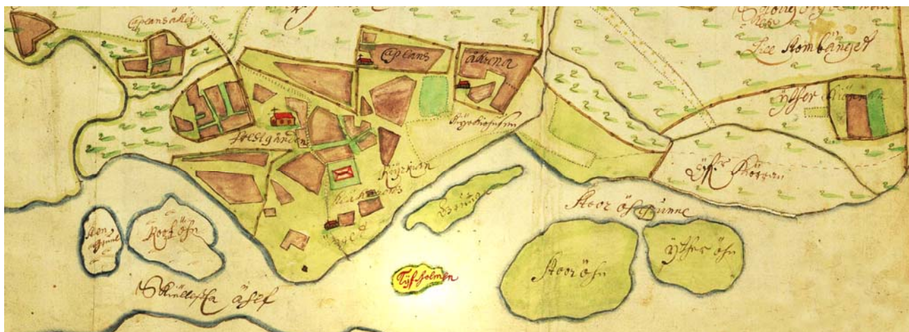
1686 Tjuvholmen i Skellefteälven nära Kyrkholmen

Tjuvholmen var en ö i Skellefteälven, strax söder om Skellefteå kyrka och uppströms Kyrkholmen. Holmen eroderades bort av älven och försvann omkring år 1700.