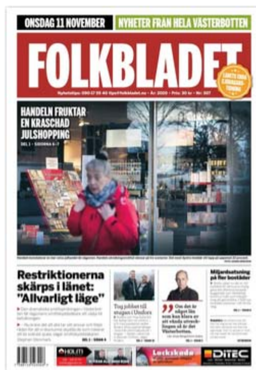
I februari 2016 blev Folkbladet sjudagarstidning då den upphörde som papperstidning och blev eFolkbladet.

Utgivningsbeviset övertogs av Högerpartiet i Västerbotten. Från 1959 utkom Nordsvenska Dagbladet, senare förkortat till Nordsvenskan, som månatligt medlemsblad för länsförbundet.