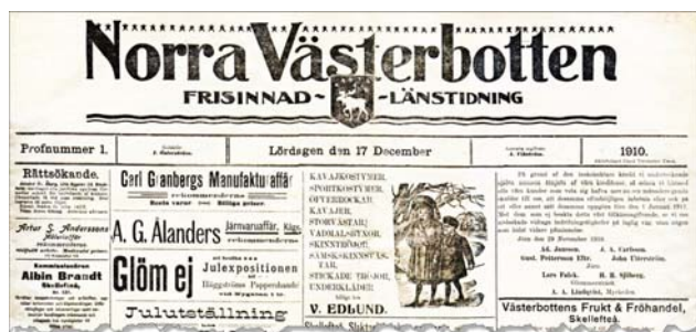
1910-12-17 Profnummer 1

Det hade 1886-1887 funnits en veckotidning med det namnet. Den nya tidningen inleddes med tre "Profnummer" där de två första trycktes i Umeå och det tredje i Skellefteå. Den första tidningen utgavs 1911-01-07 med fyra sidor tisdagar och lördagar.