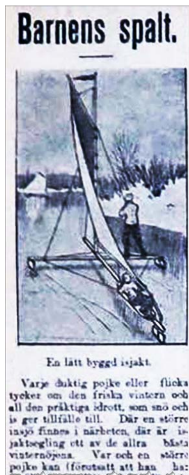
1923-02-03 I början av 1923 började man försöka locka barnen.

Upplaga var 1906 3000 exemplar per dag och 1920 var den 5500 exemplar. Från 1847 hade den blivit morgontidning.