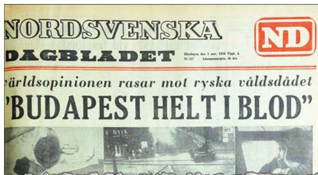
1956-11-05 Lokalnyheterna på första sidan har fått flytta på sig för Ungern-revolten.

De moderata tidningarna Skelleftebladet, Umebladet och Norrbottens Allehanda gick samman och blev 1 juni 1951 Nordsvenska Dagbladet, som bildat genom en sammanslagning av moderata Umebladet, Skelleftebladet och Norrbottens Allehanda i Piteå.