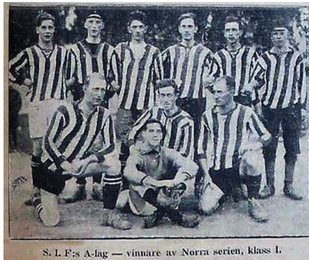
1925-09-01 Ett av de första exemplen på bilder och referat från tävlingar i lagidrotter.