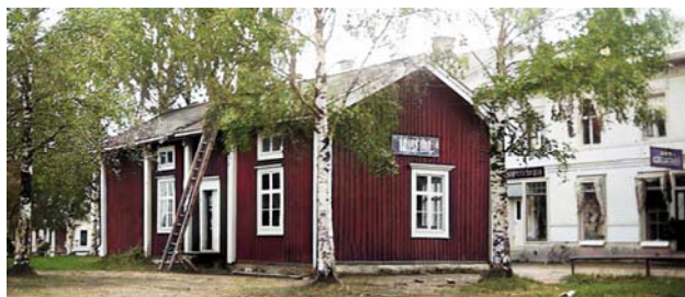
Ca 1920 Huset byggdes i slutet av 1850-talet och inrymde först en butik. Efter att Norra Västerbotten lämnat det blev här brandstation och sedan museum innan det såldes till gruvområdet i Bjurliden (Skellefteå museum, färglagd)

Tidningen upphörde 1887-09-07 då den gick upp i Skelleftebladet när den startades.