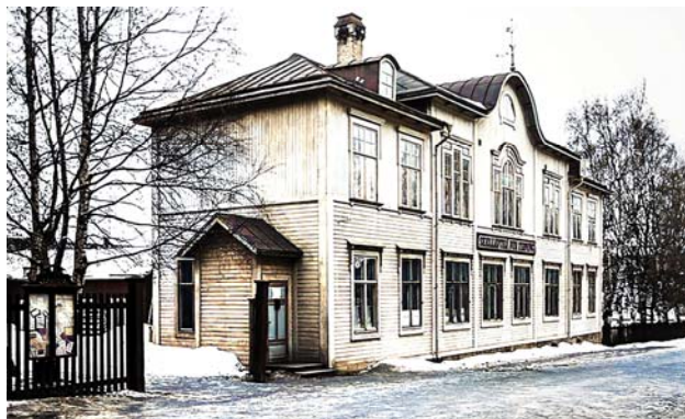
1921 Skellefteå Nya Tidning på Köpmangatan 6