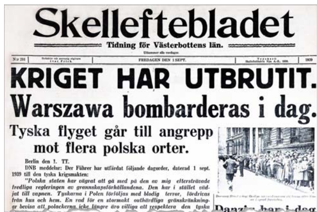
1939-09-01 Andra världskriget har utbrutit