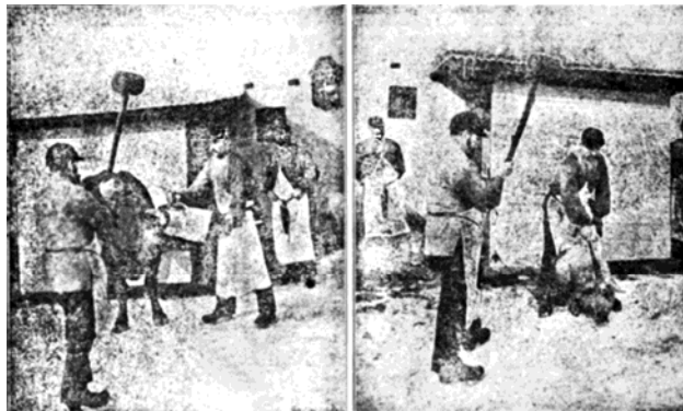
1896-11-19 Det första (?) fotot som publicerades i tidningen. Det var en annons "Mindre grymhet vid slakt" från Westerbottens läns djurskyddsförening som visade användning av slagmask