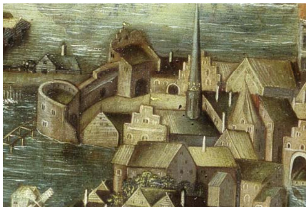
1535 Helgeandshuset i Stockholm skymts av Gråbrödraklostrets takryttare (Vädersolstavlan, Wikipedia)

Under medeltiden fanns det kombinerade ålderdomshem, fattigstugor och sjukhus. De drevs av Helige Andes orden och kallades därför Helgeandshus.