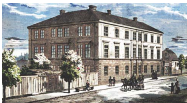
1875 Sveriges första skola för sinnesslöa barn startades 1870 på Norrtullsgatan 16 i Stockholm (Wikipedia, färglagd)

Förening för sinnesslöa barns vård bildades med målsättningen att "inom fäderneslandet verka för sinnesslöa barns uppfostran till medvetna och nyttiga medlemmar av samhället".