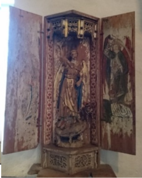
Altarskåp till Helige Mikael's ära. Sent 1400-tal, Enköpings-Näs kyrka