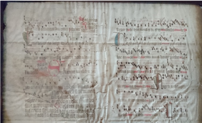
Antifonarium på latin, Enköpings-Näs kyrka