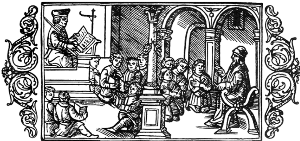
Undervisningssituation i Sverige under den första delen av 1500-talet Bild: Olaus Magnus, Historia om de nordiska folken , del 3, Uppsala 2010 [1555] (s. 712)

I Tyskland har ointresse för elitens religiositet och deras pedagogiska projekt anförts som skäl liksom att folket inte trodde att det skulle finnas behov av mässpräster och lärda män i framtiden. 36